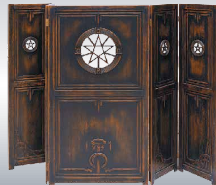
А. Дмитриев. Ширма для детской военно-трудовой коммуны «ЛЕНОБЛОНО», 1934. СССР. Галерея «Эритаж»