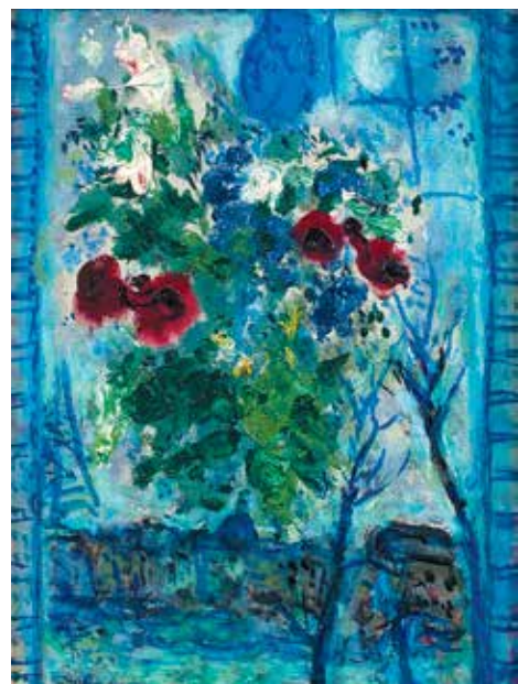
Марк Шагал. «Цветы в окне», 1959. Галерея Willow