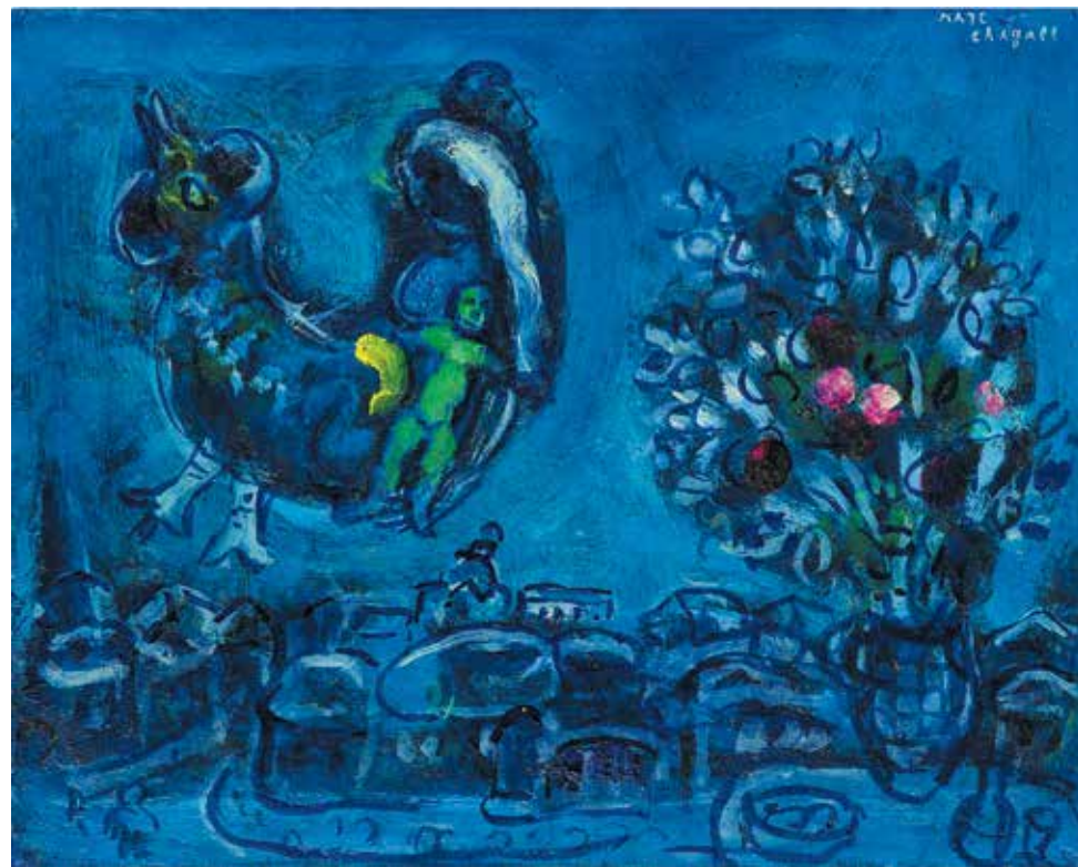
Марк Шагал. «Воспоминание о родной деревне», 1962. Галерея Stern Pissarro