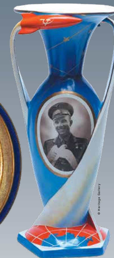
Евгений Никитин. Фарфоровая ваза «Космос» с портретом Юрия Гагарина, 1960-е. СССР. Галерея «Эритаж»