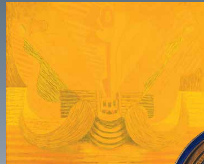
Серж Шаршун. «Гондола №35», 1953. Галерея Patrice Trigano

Доменико Босси. Портретная миниатюра на слоновой кости Великой княжны Марии Павловны, дочери императора Павла I и императрицы Марии Федоровны, 1804. Галерея Dario Ghio