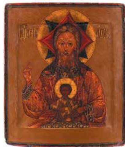
Икона «Бог-Утец», XVIII в., Россия. Галерея Brenske

Русское и советское искусство пользуется на BRAFA неизменным успехом. В этом году на ярмарке дебютировала московская галерея «Эритаж», став одной из 133 галерей-участниц