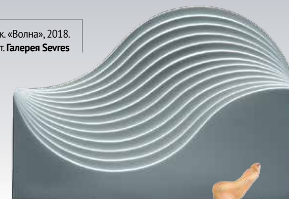
Хулио Ле Парк. «Волна», 2018. Фарфоровый бисквит. Галерея Sevres