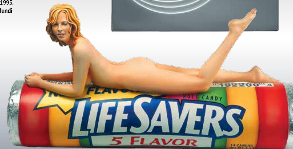
Мел Рамос. «Пять вкусов Фриды», 2010. Раскрашенная полиэфирная смола. Галерея Patrice Trigo