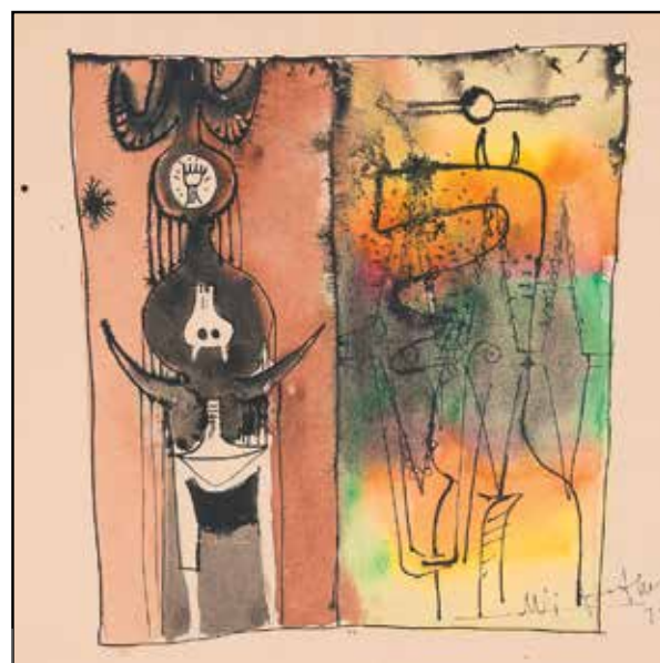
Вифредо Лам. Без названия, 1949. Галерея des Modernes