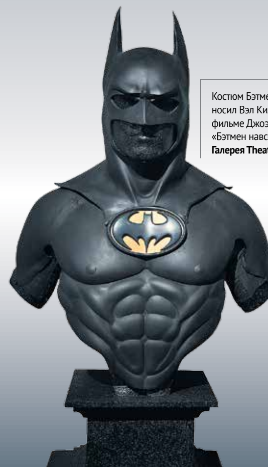
Костюм Бэтмена, который носил Вал Килмер в фильме Джоэла Шумахера «Бэтмен навсегда», 1995. Галерея Theatrum Mundi

На BRAFA традиционно представлено африканское, классическое, модернистское и современное искусство