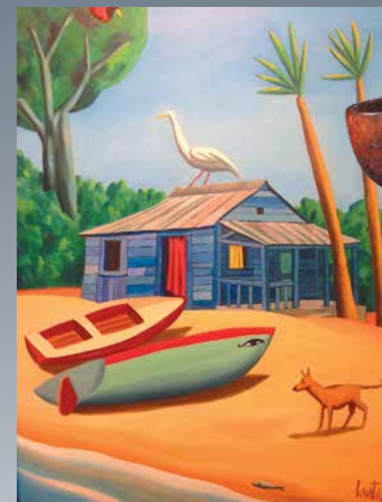
Жак де Лусталь. «Шум на крыше». Галерея Huberty Breynle