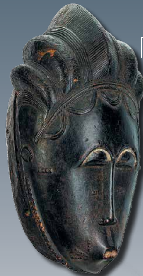
Маска народа бауле, конец XIX в. Кот-д'Ивуар. Галерея Didier Claes