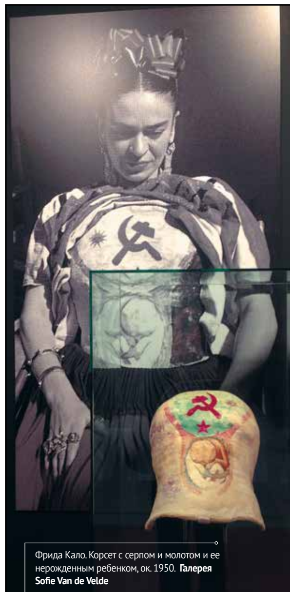
Фрида Кало. Корсет с серпом и молотом и ее нерожденным ребенком, ок. 1950. Галерея Sofie Van de Velde