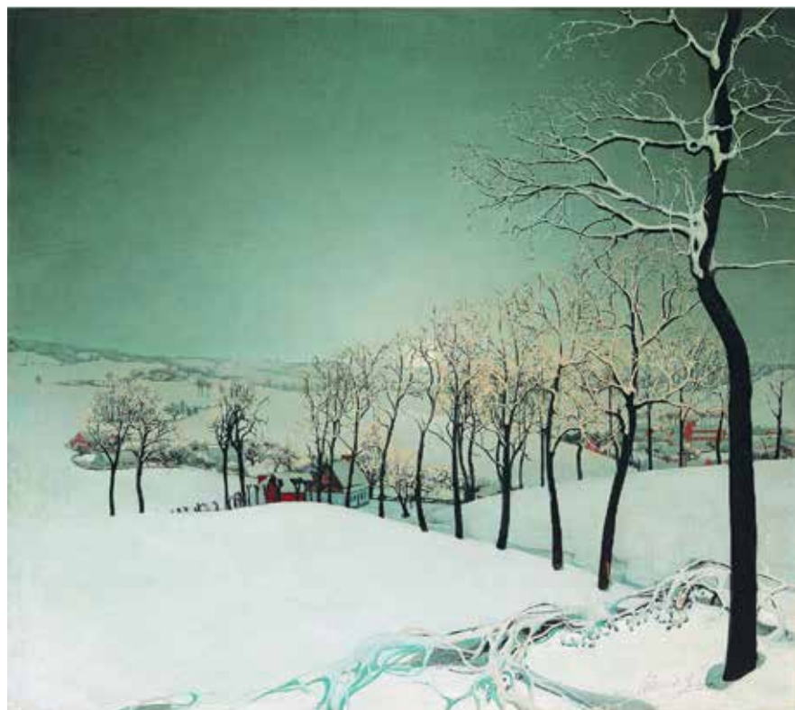
Валериус де Саделер. «Зимний пейзаж в сумерках», 1924. Галерея Oscar de Vos

Чтобы показать все экспонаты, представленные на BRAFA, понадобится не журнал, а толстая книга. Представляем те, что особо запомнились редакции.